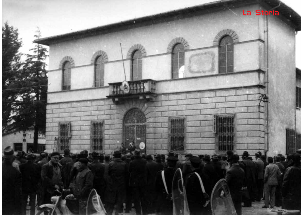
Sopra: Comizio elettorale davanti al vecchio comune di Quarrata. Anni '60. Sotto: Vecchio comune di Quarrata in ristrutturazione. Primi anni '70.