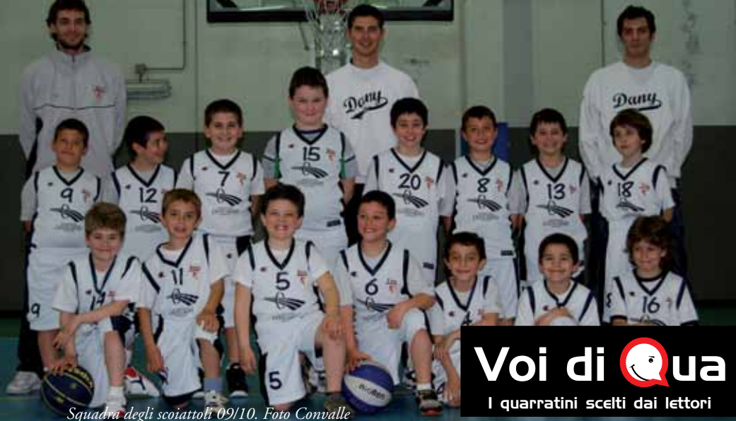
Squadra degli scoiattoli 09/10.