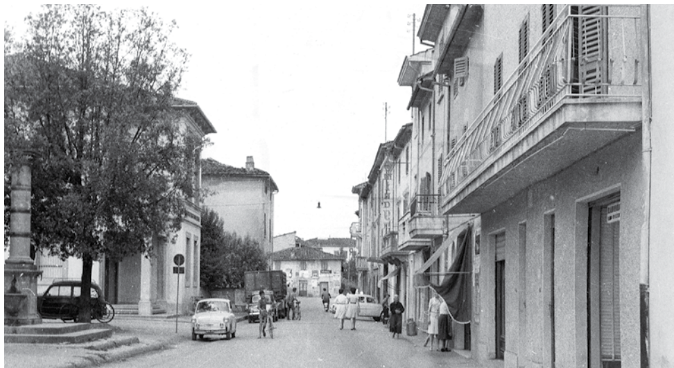
Via Roma. Fine anni '50/ primi '60.