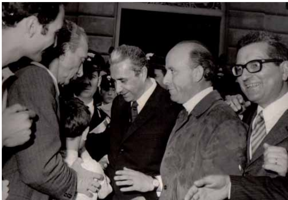
Aldo Moro in visita a Quarrata (a destra, il sindaco Vittorio Amadori). Anni '60.

Per dare corpo al suo sogno, l'intento è quello di curiosare, lavorare ed ordinare il materiale contenuto nel suo archivio (archivio? in realtà, come era nella sua indole, scatoloni con documenti alla rinfusa!), al fine di realizzare la mostra da lui desiderata ed eventualmente un filmato con spezzoni delle trasmissioni di TV Quarrata, con la speranza che, a lavoro ultimato, il Nonno sia fiero del risultato!