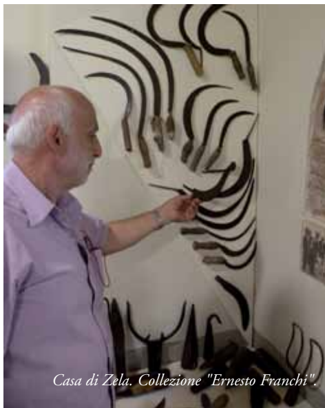
Casa di Zela. Collezione "Ernesto Franchi".

quelli sono mestieri - il mondo va verso la grande distribuzione: piccolo e bello non è più di moda. Eppure la fortuna dell'Italia intera è stata costruita proprio su queste basi che ora vengono rinnegate.