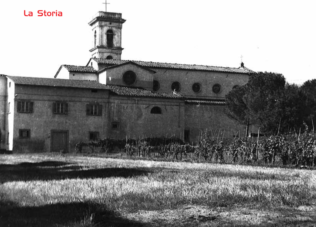
Chiesa Santa Maria Assunta di Quarrata, vista da due angolazioni diverse: sopra dall'attuale Piazza Aldo Moro e sotto vista da Via Folonica. Entrambe le foto risalgono agli anni '50.