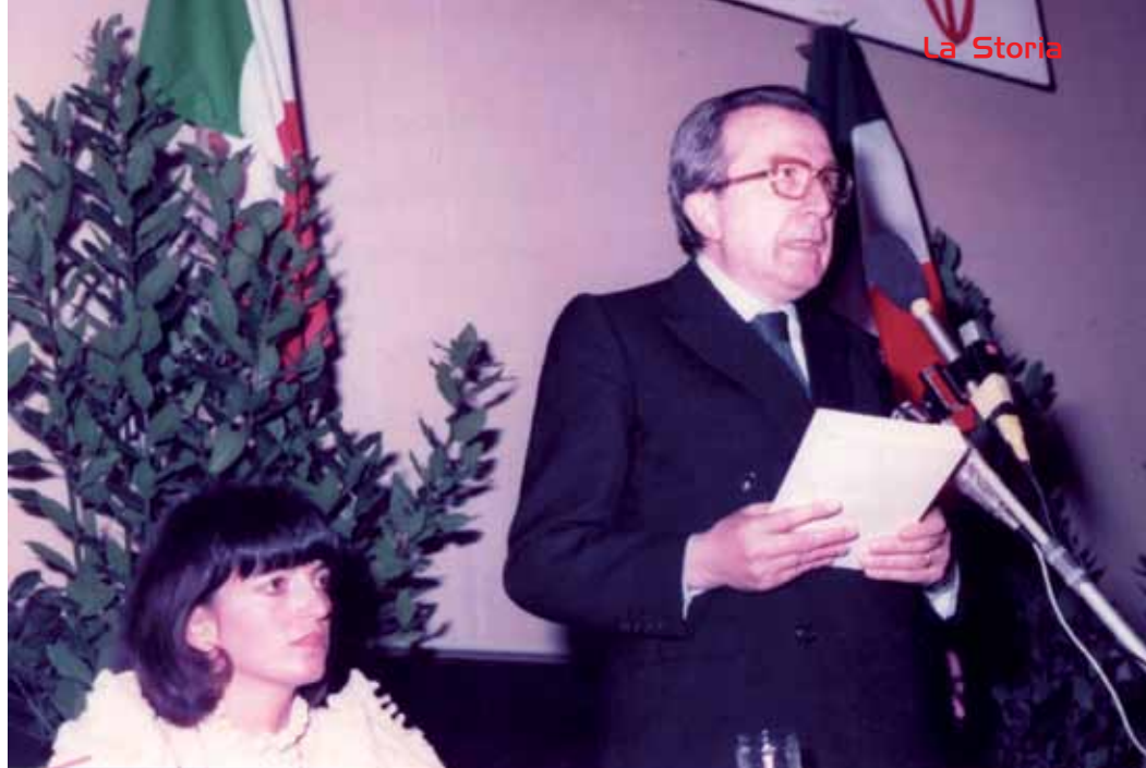
Giulio Andreotti in visita a Quarrata (Teatro Nazionale) per la presentazione del libro della Prof.ssa Alessandra Covizzoli (a sinistra). 14 maggio 1983.