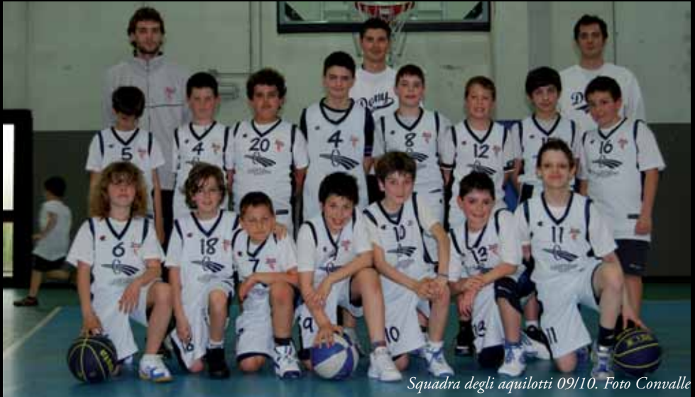
Squadra degli aquilotti 09/10.

Da noi il Basket è poco pubblicizzato e ci sono pochi articoli anche su i giornali. Importante è la Festa dello Sport che si tiene ogni anno a Settembre per far conoscere anche questo sport. Noi mamme d'altronde facciamo il possibile ma siamo in poche.