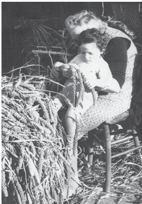
Località Ferruccia, anni '70.

Il panico veniva seminato a maggio e maturava fino ad agosto - primi di settembre. La raccolta iniziava alla metà di settembre fino alla fine del mese, il tutto rigorosamente fatto a mano con l'utilizzo di strumenti come la falce. Le pannocchie (dette "nappe") venivano tagliate lasciando il gambo della pianta. Il raccolto arrivava poi nell'aia, dove le donne pulivano le pannocchie dall'eccesso e preparavano i mazzi (foto a fianco): ogni mazzo comprendeva un massimo di trenta pannocchie che poi venivano messe a seccare su dei tronchi o tubi di ferro (foto pag. 49). Se la stagione era buona e ben soleggiata, i mazzi seccavano in un paio di giorni, ma se pioveva ci poteva volere anche più di una settimana perchè il panico doveva essere continuamente coperto con teli, dato che lo si teneva all'aperto. Quando mancava un giorno alla maturazione, si mettevano sotto i mazzi (che rimanevano sospesi in aria) piccoli bracieri accesi con lo zolfo: questo serviva a disinfettare le piante, scacciare eventuali insetti e conferire al panico un leggero riflesso dorato. Poi lo si teneva un'altro giorno all'aria aperta, prima della vendita.