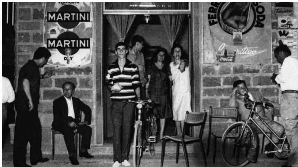
Bar Testai in Piazza Risorgimento, all'angolo tra Via Roma e Via Montalbano. Anni '50